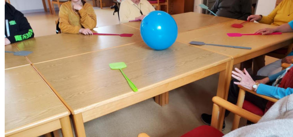
Besuch eines Seniorenheims

Evang.-Luth. Dekanat Ingolstadt, VHS Neuburg