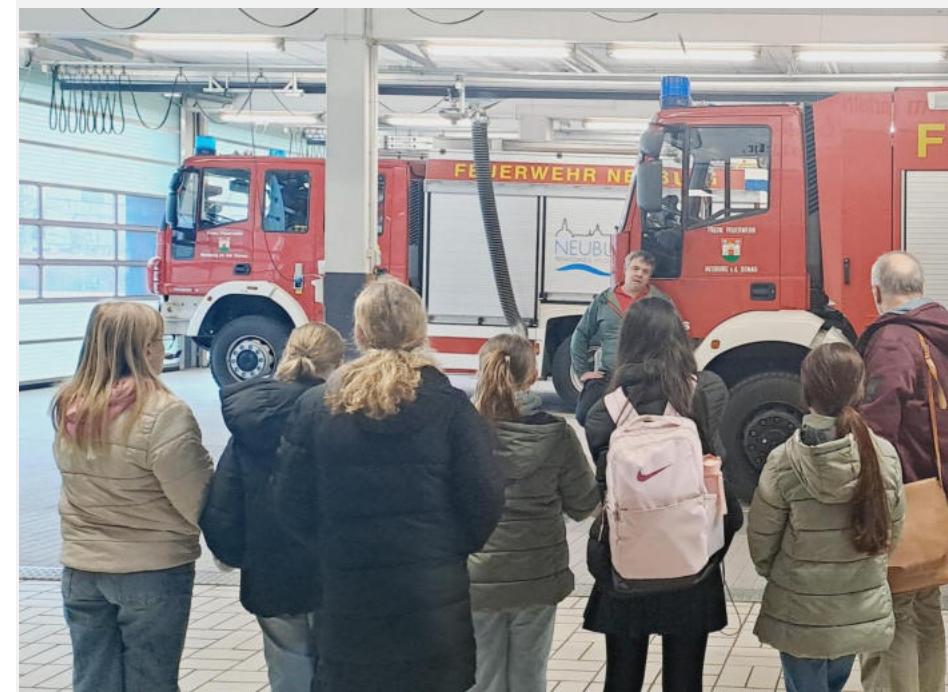
Besuch der Feuerwehr