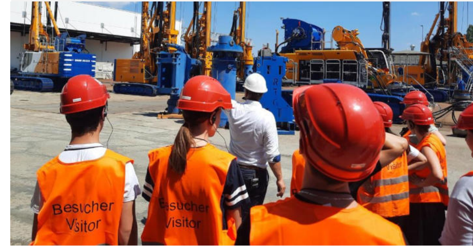
Besuch bei der Bauer AG